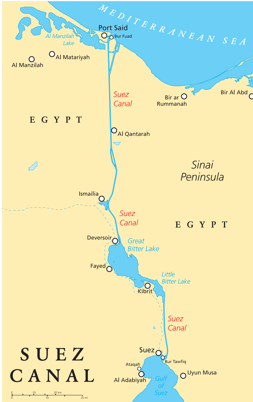
Resim 5.2 Süveyş Kanalı Siyasi Haritası

ABD'de Eisenhower Yönetimi, Britanya ve Fransa'nın Orta Doğu'daki etkisinin tamamen ortadan kalktığı ve Bağdat Paketi'nin kuruluş amaçlarını yerine getirmesinin imkansızlaştığı bu dönemde doğrudan ve etkili müdahale kararı almıştır. ABD'nin yeni Orta Doğu politikası Türkiye'nin bölgeye yönelik politikasını da belirlemiştir. 5 Ocak 1957'de ilan edilen bu Doktrin, Sovyetler Birliği'nin bölgede siyasi ve askeri kazanımlarını sınırlandırmayı amaçlamıştır. Bu dönemde bir dizi Batı karşıtı gelişme yaşanmıştır. 1957 Nisan'ında Ürdün'de Suriye destekli bir darbe girişimi engellenmiştir. Kral Hüseyin bunun üzerine anayasayı askıya almış ve sıkıyönetim ilan etmiştir (Anderson 1995: 24). Buna karşılık Suriye'de Cumhurbaşkanı Şükrü Kuvvetli ise 1957'den itibaren Mısır ve Sovyetler Birliği'yle yakınlaşma siyaseti takip etmeye