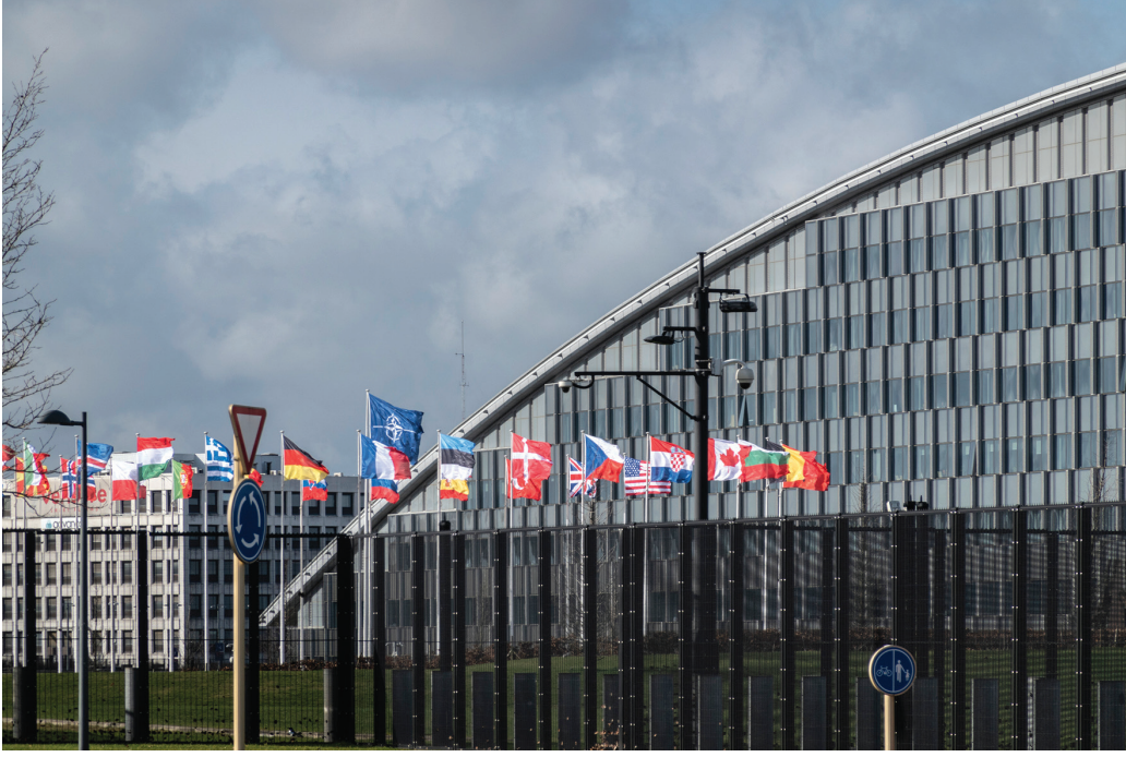
Resim 5.1 Brüksel, Belçika: NATO Karargahı, İttifakın siyasi ve idari merkezi

ması konusunda ısrarcı olması üzerine Britanya'nın girişimleri boşa çıkmıştır. 16-20 Eylül 1951 tarihinde yapılan NATO Bakanlar Konseyi toplantısında Türkiye ve Yunanistan'ın NATO üyeliğine yönelik süreç başlatılmıştır (Erhan 2019: 550). 17 Ekim 1951'de Londra'da kabul edilen bir protokol ile Türkiye ve Yunanistan'ın üyeliğine karar verilmiştir (Akipek 1967: 9). Türkiye'nin NATO'ya üyeliği Türkiye Büyük Millet Meclisi'nde görüşülmüştür. 18 Şubat 1952'de kabul edilen bir kanunla Kuzey Atlantik Antlaşması onaylanmış ve bu antlaşmaya taraf olan devletlerle yapılacak antlaşmaları onaylama yetkisi Bakanlar Kurulu'na verilmiştir. Bu şekilde Türkiye'nin NATO üyeliği gerçekleştirilmiştir.