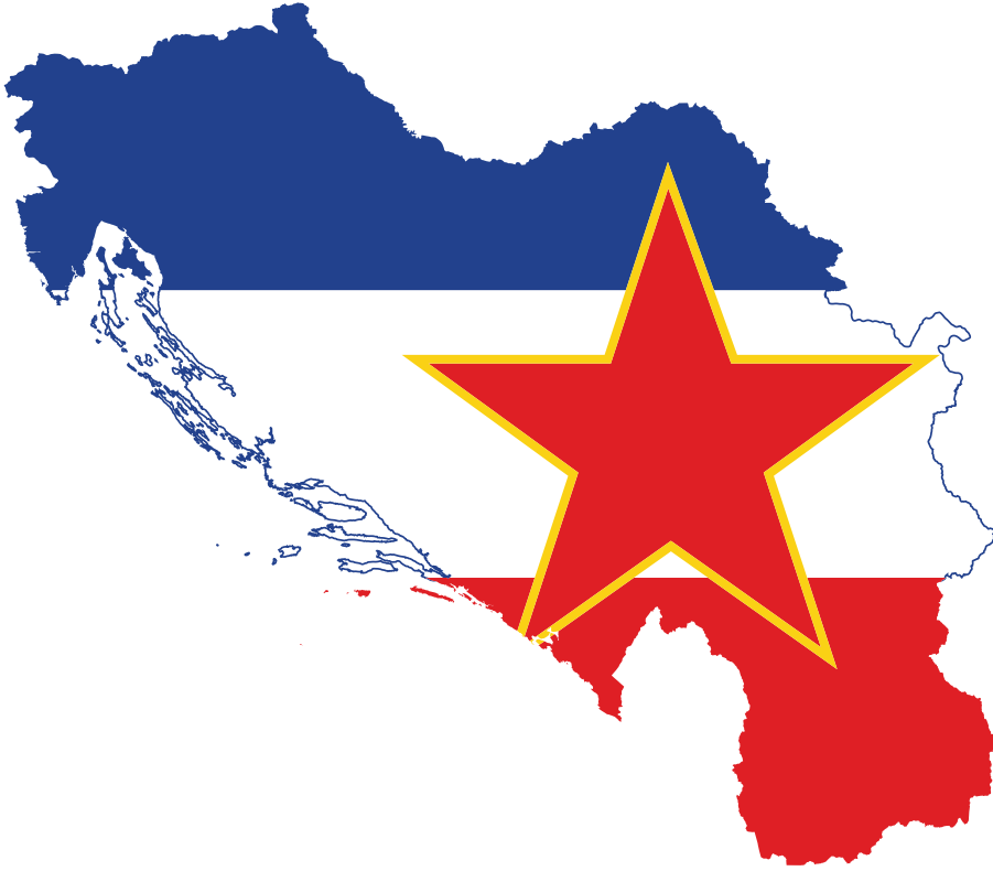
Resim 5.4 Eski Yugoslavya Haritası

Türkiye’nin Yunanistan’la ilişkileri Kıbrıs meselesi üzerinden 1950’lerin ikinci yarısında bozulmaya başlamıştır. Yunanistan 1955 yılında Balkan İttifakı’nın ikinci toplantısının yapılmasını engellemiştir. 1955 yılındaki 6-7 Eylül olayları sonrasında Yunanistan Türkiye’ye karşı çok daha sert bir diplomatik tavır takınmıştır.