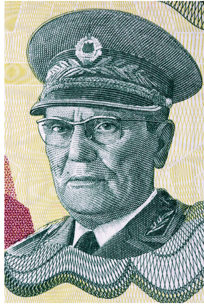
Resim 5.3 Josip Broz Tito

lavya ve Bulgaristan'ın bir Balkan Federasyonu kurma fikridir. Tito, Makedonya sorunu üzerine Bulgaristan'la Federasyon kurma çabasına girişmiştir. Bulgar lider Dimitrov ile bu konuda oldukça iddialı bir proje hazırlamışlardır. Bu konuda da Stalin'in tepkisiyle karşılaşmışlardır. Tito ayrıca Yunanistan İç Savaşı'nda Yunan Komünist Partisi'ne açık destek vermiş ve bu durumu gerekçe göstererek Arnavutluk'un güneyinde askeri üs kurmak istemiştir. Kasım 1944'te Almanlar Arnavutluk'tan çekilirken, Enver Hoca'nın liderliğindeki Komünist Parti, Yugoslav Partizan hareketinin desteğiyle Arnavutluk'ta siyasi ve askeri olarak güçlü konuma gelmiştir. Temmuz 1946'da Yugoslavya ile Arnavutluk arasında Dostluk ve Karşılıklı Yardım Anlaşması imzalanmıştır (Perovi 2007: 43). Enver Hoca daha savaş yıllarından itibaren Tito'nun ve Partizan hareketinin askeri ve ekonomik desteğiyle Arnavutluk Komünist Partisi'ni kurmuş ve haki-miyet sağlamıştır. Buna karşın yine de Enver Hoca Tito'nun Arnavutluk üzerindeki planlarına hep şüpheyle yaklaşmıştır.